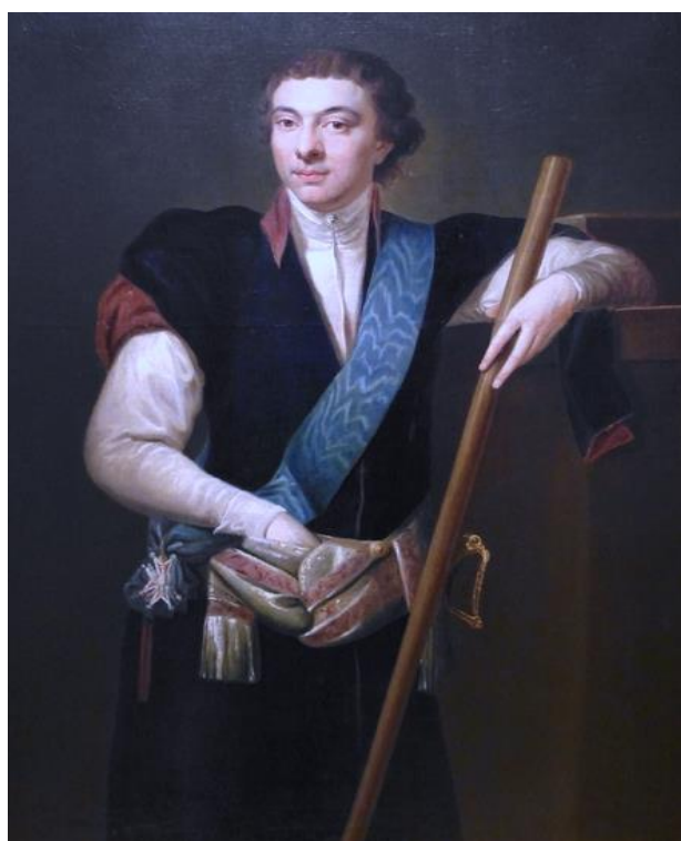
Kazimierz Nestor Sapieha