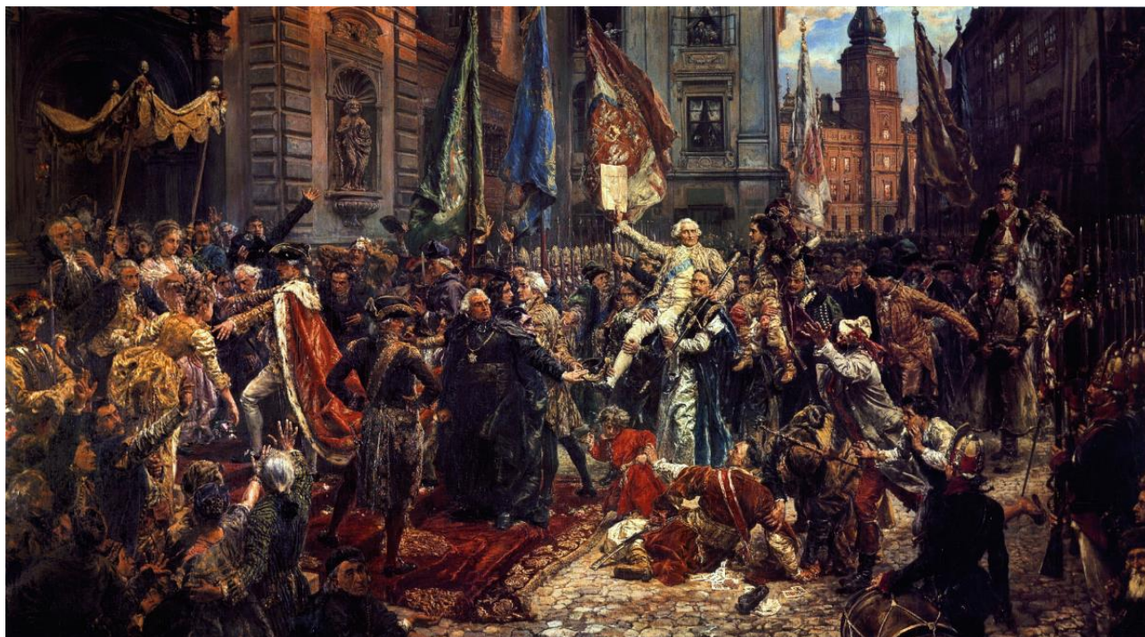
Jan Matejko „Konstytucji 3 maja 1791 roku”

Posłowie obradujący podczas Sejmu Wielkiego dążyli do przebudowy ustroju Rzeczypospolitej. Byli zwolennikami reform, które miały sprawić, iż Polska stałaby się państwem nowoczesnym i suwerennym. Zależało im na tym, aby stworzyć silny kraj, który pokona zaborców i odbuduje się po I rozbiore Polski. Dlatego też 3 maja 1791 r. uchwalono Ustawę Rządową, która stanowiła gwarancję systemu konstytucyjnego, wprowadzała trójpodział władzy, dzieląc ją na ustawodawczą, wykonawczą i sędziowską. Na jej mocy ustrój państwa zmienił się z monarchii dziedzicznej na konstytucyjną. Ustawa wzmacniała władzę wykonawczą i osłabiała pozycję magnatów. Ograniczała złotą wolność szlachecką, odbierała gołocie szlacheckiej prawo głosu i decyzji w sprawach państwowych, wprowadzała polityczną równość mieszczan i szlachty, poprawiała sytuację chłopów. Konstytucja formalnie zniosła liberum veto , wolną elekcję, poselskie konfederacje i sejmy skonfederowane. Obowiązywała przez 14 miesięcy i 3 tygodnie, do zawązania 27 kwietnia 1792 roku konfederacji targowickiej. Na prośbę przywódców zdradzieckiego związku do Polski wkroczyła armia rosyjska. Konfederaci przejęli władzę i unieważnili Konstytucję 3 maja, przywracając dawne przywileje szlacheckiej.