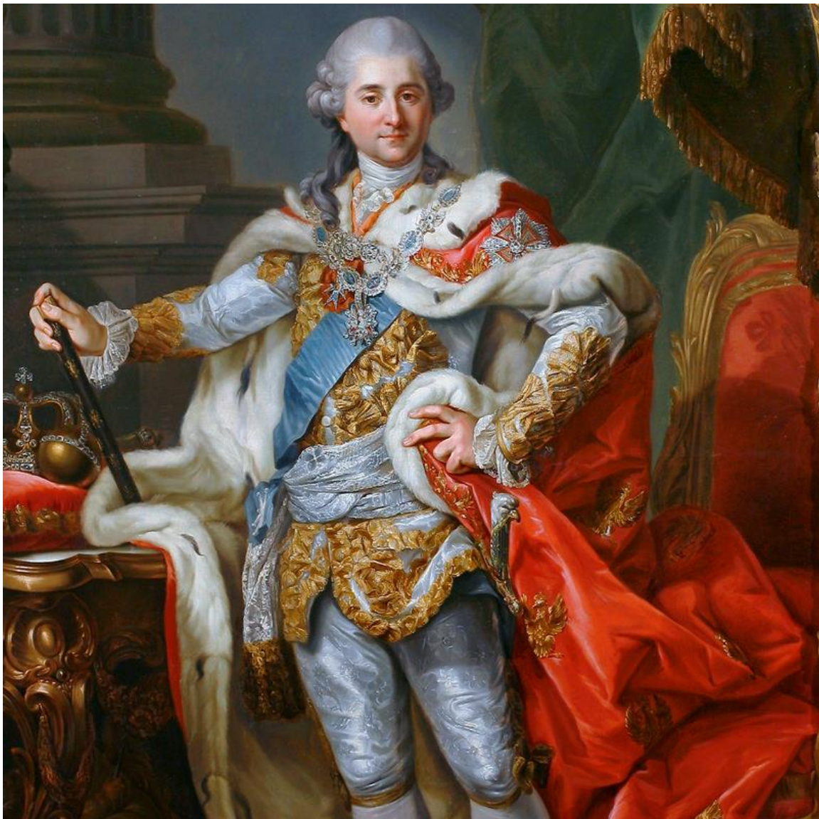
Stanisław August Poniatowski

Ostateczny kształt nadał jej 25 marca 1791 roku przywódca stronnictwa patriotycznego Hugo Kołłątaj, współtwórcami konstytucji byli również: Ignacy Potocki oraz ostatni król Polski Stanisław August Poniatowski.